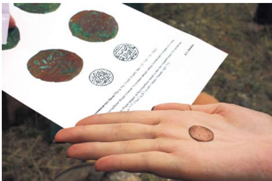
Крымская монета 1313 года