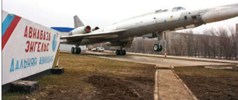
На энгельсскую авиабазу прибыла делегация из США