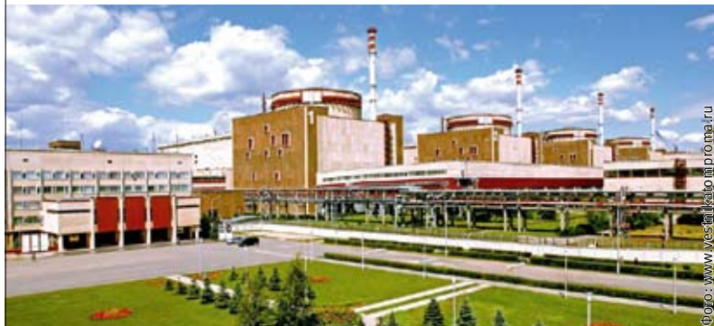
Увеличит ли мощность Балаковская АЭС?