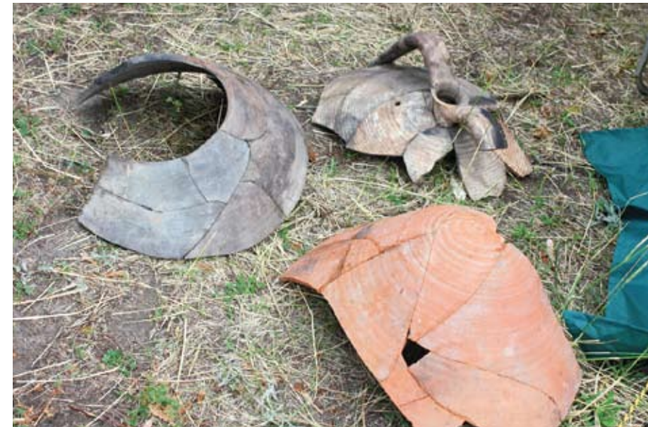
...будут восстановлены в средневековые сосуды

➔ Стр. 1 Рядом с ним кирпич Советской России. Во всяком случае, об этом свидетельствует «серпасто-молоткастый» штамп. Вот такая переключка стройиндустрий различных эпох. Краеведам предстоит ответить на множество вопросов: почему обвалилось это здание, какой было высоты, что находится под рухнувшей стеной. Пока не вызывает сомнений одно: это было монументальное здание. Для того чтобы ответить на другие вопросы, археологам нужно дойти до материка — грунта, сформировавшегося до появления человека. «Тут, как говорится, «вскрытие покажет», — улыбается Дмитрий. — Вот разберем стену и пойдем вглубь — думаю, там нас ждет много интересного. По итогам раскопок можно будет воссоздать трехмерную модель здания и вычислить его параметры. Сейчас же, когда мы находимся в поле, самое главное — четкая фиксация и описание находок».