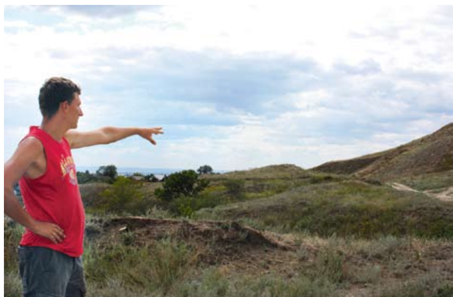
На этом месте пройдет праздник древности

трализованного праздника «Один день из жизни средневекового города Увека», который будет приурочен к празднованию Дня города в Саратове. Он пройдет в рамках научно-практического семинара «Изучение, сохранение и популяризация археологического наследия Увекского городища». К нам в гости приедут ведущие мастера исторической реконструкции России. На глазах у посетителей городища гончары, кузнецы изготовят вещи, подобные тем, которые саратовские краеведы находят спустя столетия. И если слух о нашем Увеке пройдет хотя бы по Поволжью, тайны древнего Увека заинтересуют многочисленных туристов. Тем более что наша область находится в перманентном поиске местного бренда. А искать-то и не надо. Схожая Увецкого городища открывается потрясающая панорама на современный Саратов. Вниз по Волге сплавляется баржа, параллельно движется железнодорожный состав. Наверное, так же семь веков назад хозяева Увека наблюдали, как приближаются к городу иноземные купцы. Когда находишься на Увекском городище, многовековая полифония поглощает тебя полностью. Проникаешься уважением к людям, которые много столетий назад создали мощнейший строительный, торговый центр Поволжья. Создали с любовью. И эту самую любовь не всегда найдешь в современных саратовцах. Давайте учиться у предков.