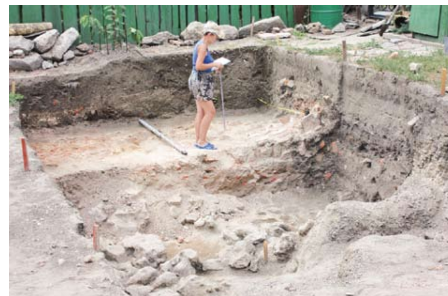
До материка ещё далеко