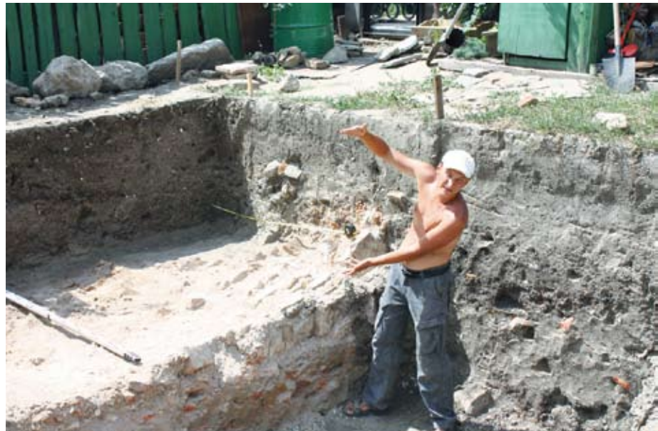
Археологи откопали стену золотоордынского здания