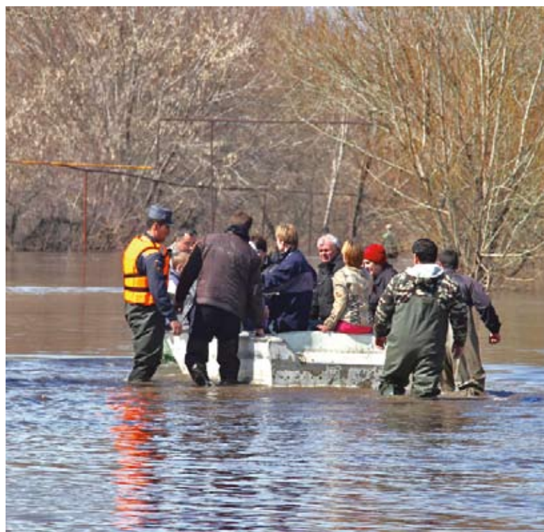
Спасение жителей при наводнении

На заседании ВПК было предложено создать специальную службу по предупреждению катастроф и управлению рисками. Но защитит ли нас от бед новая чиновничья структура? Ведь гром уже грянул — Саяно-Шушенская ГЭС, разрыв дороги в Приморье, Крымск... Что следует? Как писал тот же Малинецкий в одной из статей, «Пока что Бог любит Россию, но когда он отвернется от нас, Чернобыльская катастрофа покажется бледным подобием того катаклизма, который имеет все шансы произойти».