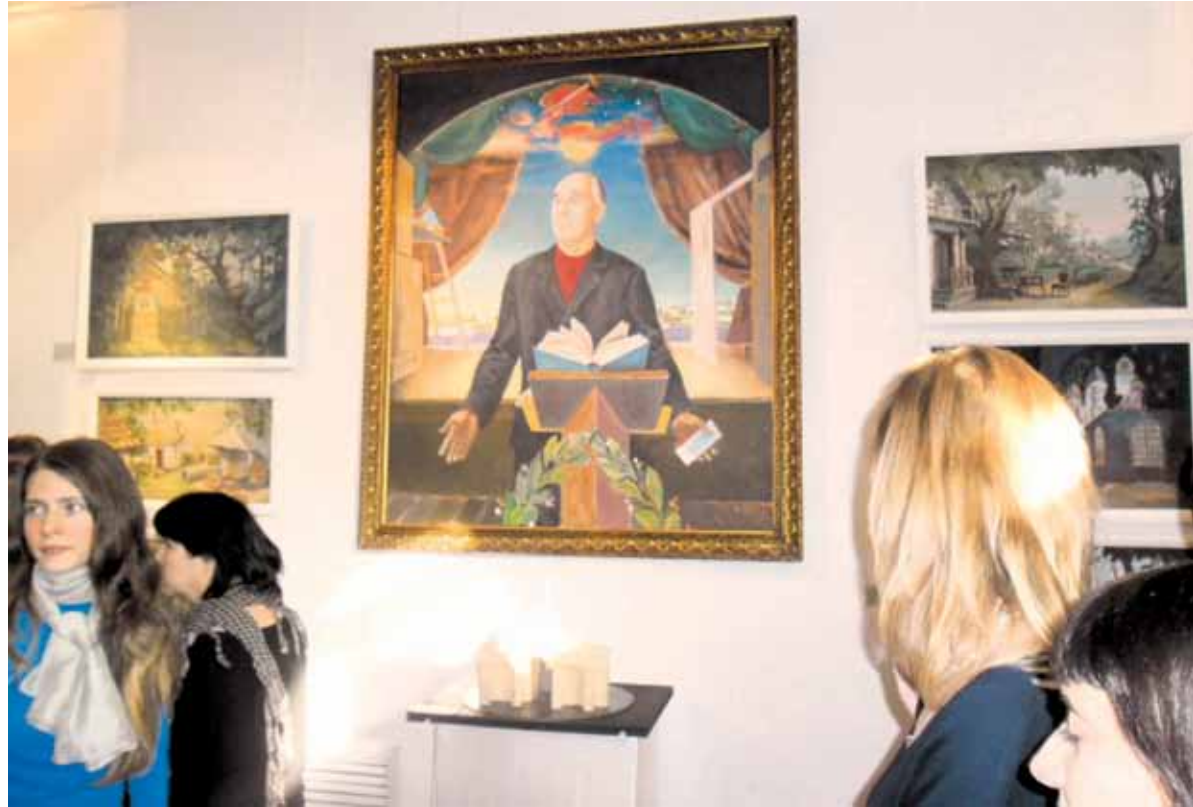
ТЮЗ Киселева чит традиции Мастера и ищет новый сценический язык

27 марта — в Международный день театра — в Саратовской Академперере открылась грандиозная выставка, посвященная 210-летию театрального искусства в Саратове.