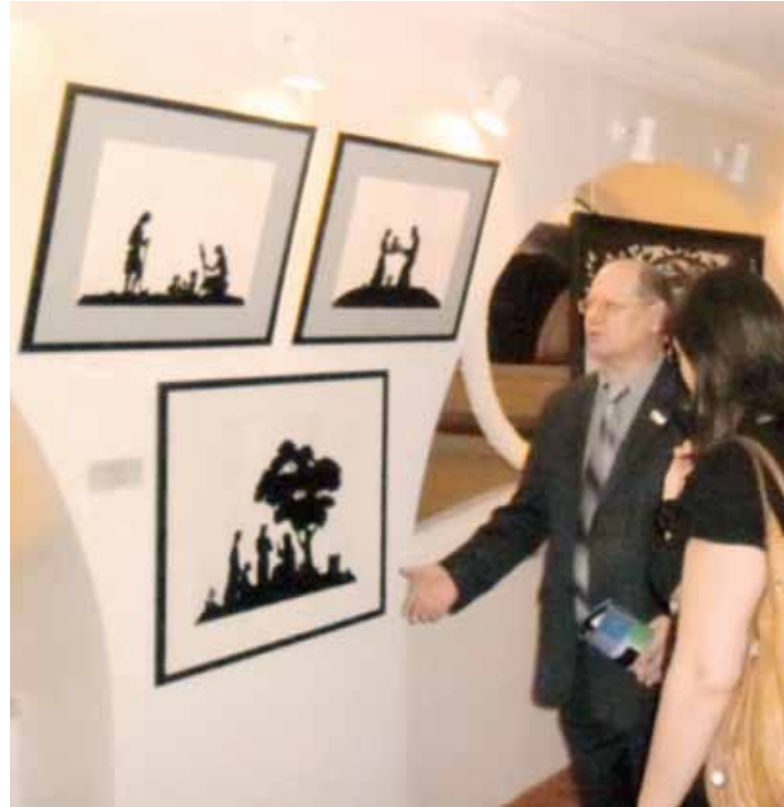
У стенда театра теней

и радуется, что гости города смогут увидеть: один из старейших детских театров страны имеет богатейшую историю и охотно разрабатывает новый сценический язык. Выставка исчерпывающе повествует об истории Собиновского фестиваля. Она сопровождается колоритными костюмами, рецензиями на лучшие спектакли Академперы. Театр драмы имени И.А.Слонова представлен утонченными эскизами изысканного Юрия Наместникова. Сам мастер увлеченно рассматривает