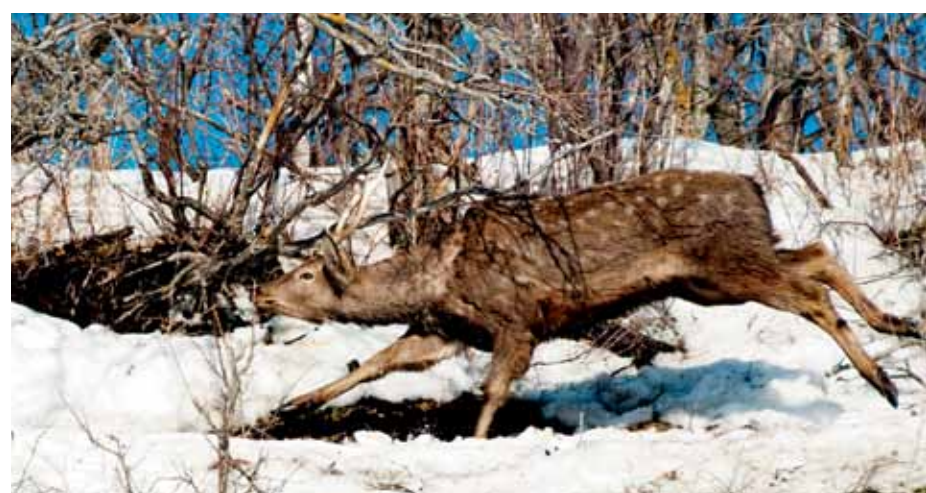
Представители богатой хвалынской фауны