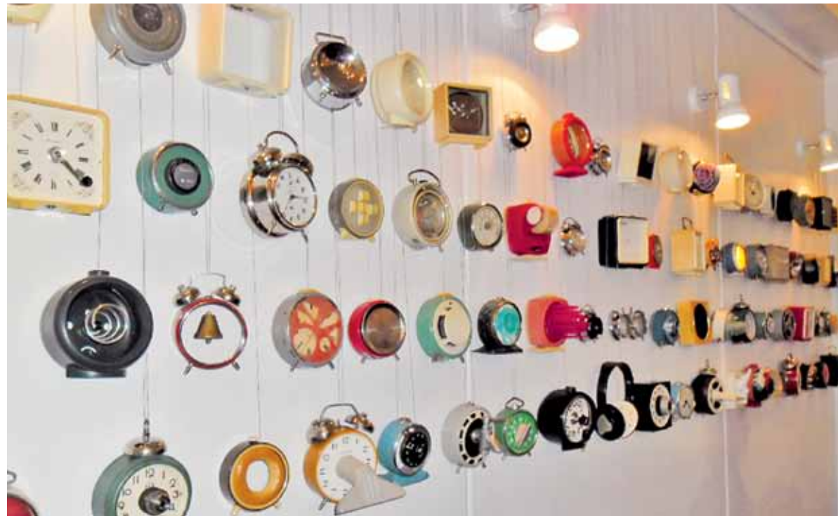
Декорации к спектаклю АТХ «Когда пройдет 5 лет»