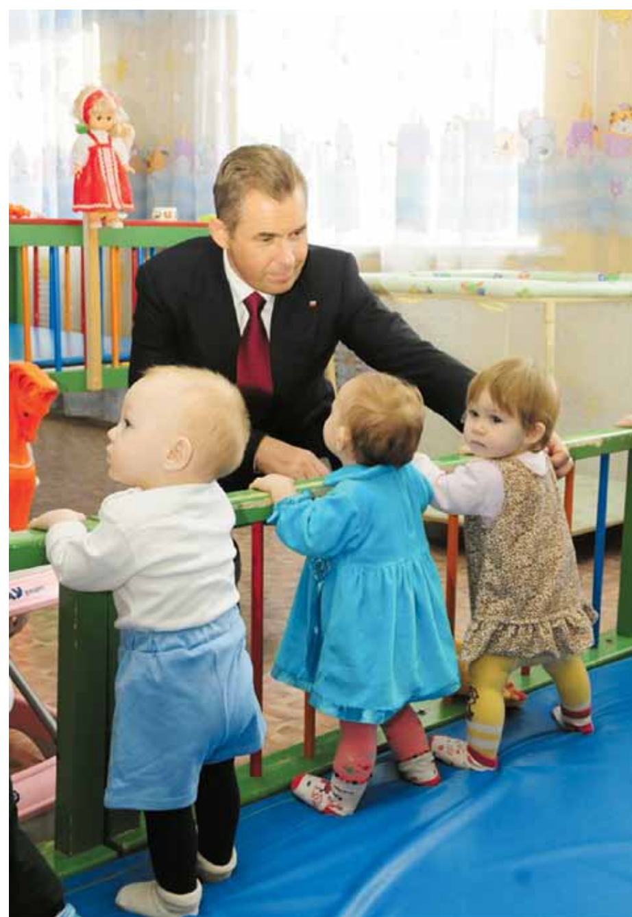
Павел Астахов: «Дети — самый драгоценный наш ресурс»

Говоря о положительных моментах, Павел Астахов в первую очередь отметил существенное снижение подростковой преступности. Если в 2011 году было зарегистрировано 931 преступление с участием несовершеннолетних, то в прошлом их число уменьшилось практически на 30% — до 641. Снизилось и общее число преступлений, жертвами которых стали дети. При этом значительно возросло количество сексуальных посягательств на несовершеннолетних. В 2012 году было зарегистрировано 135 подобных случаев. Вместе с тем в области в три раза сократилось количество специалистов, работающих с детьми, пострадавшими от насилия и других преступных посягательств.