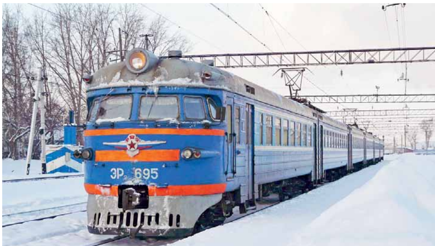
Пригородные маршруты могут остаться без господдержки

количество плацкартных и общих вагонов, что, разумеется, не на руку пассажирам со средним достатком.