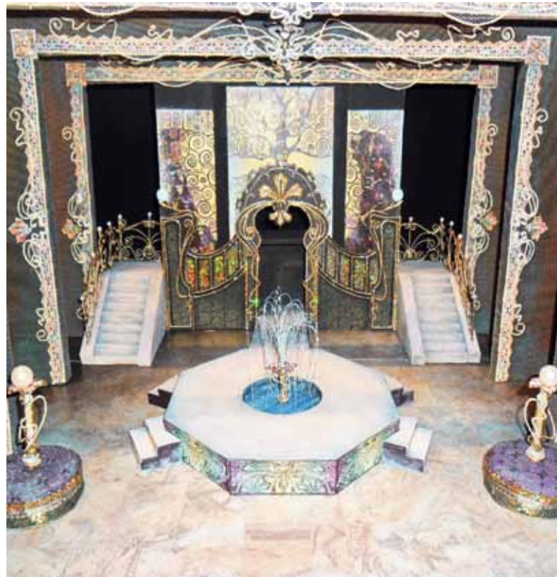
Макет спектакля Академперы «Баядера»