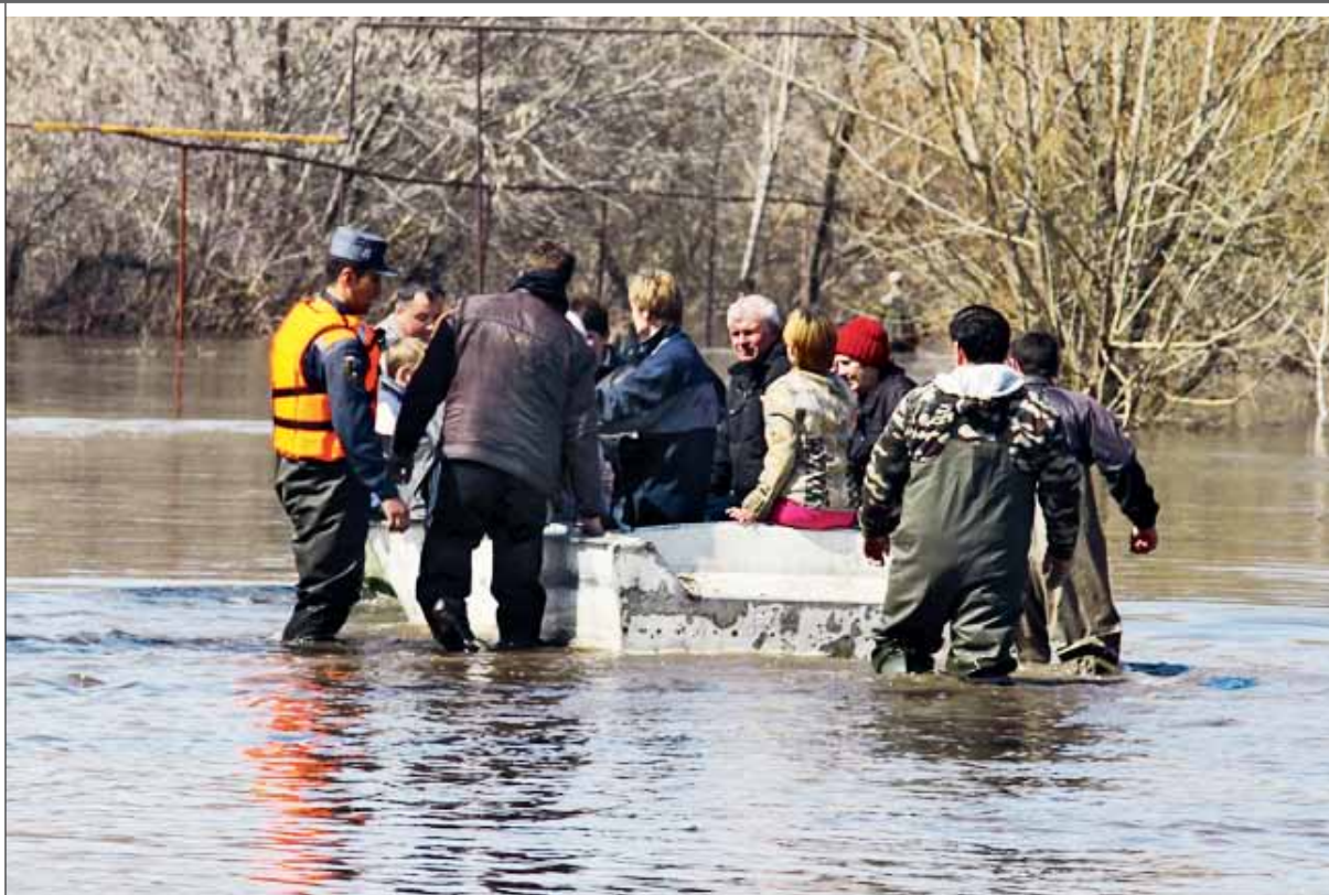
Начало паводка ожидается в первых числах апреля

На всем полигоне российских железных дорог работают 14 филиалов ОАО «ФГК». Открыты представительства ОАО «ФГК» в Украине и Республике Казахстан.