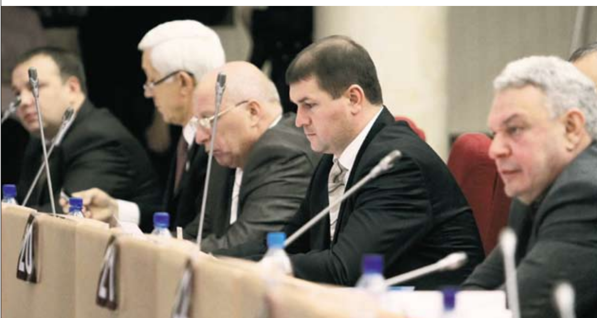
Главной задачей областной власти остается снижение дефицита бюджета

ОАО «ПГК» проводит 26 декабря 2012г. в 15.00 часов (мск.) квалификационный отбор № 1-МЕТ с целью выбора организаций — покупателей лома черных металлов в 2013 году, являющегося собственностью ОАО «ПГК». Подробную информацию можно получить на сайте ОАО «ПГК» — www.pgkweb.ru в разделе Клиентам и партнерам — «Продажа металлолома».