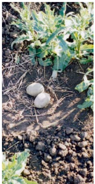
В Саратовской области находится самая крупная в Восточной Европе гнездовая популяция дрофы