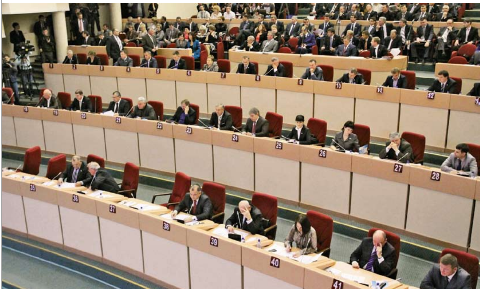
Экономить народные избранники начали с себя

Развитие данного вида туризма в области — новое явление, поскольку, несмотря на огромный потенциал, число людей, увлекающихся бердвотчингом, сравнительно невелико. По-прежнему наибольшее развитие получают традиционные виды туризма — пляжный, лечебный. Однако, учитывая имеющиеся научные исследования, у области есть достаточные ресурсы для развития данного вида туризма, — отметили в министерстве молодежной политики, спорта и туризма.