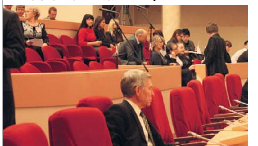
Поправки в городской бюджет вызвали у депутатов ряд вопросов