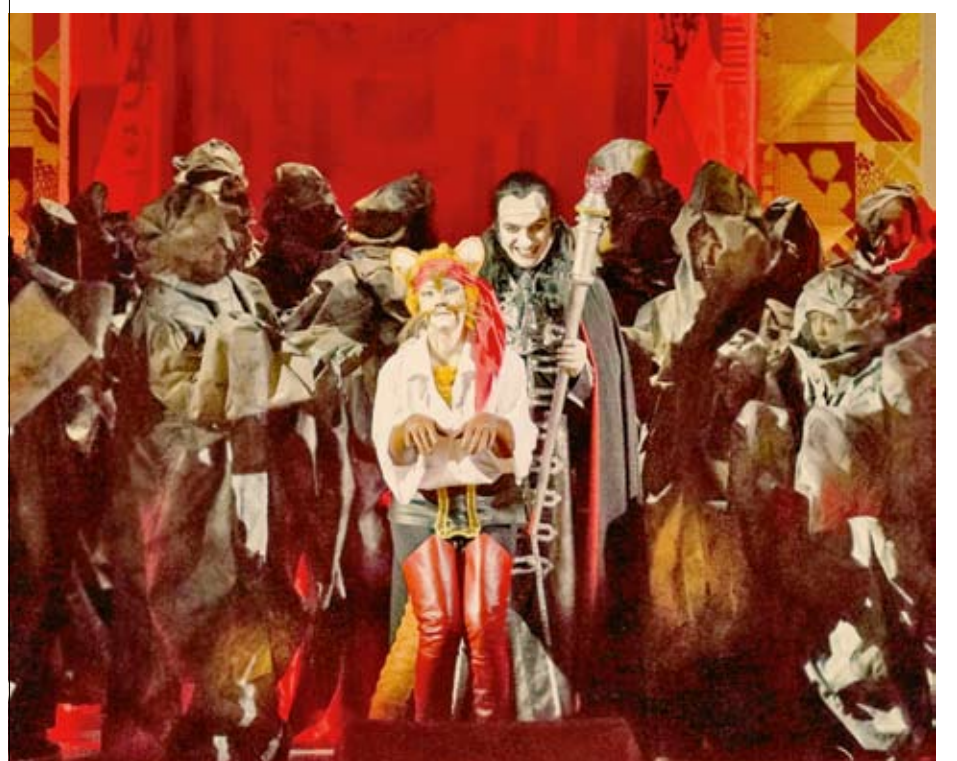
...и победил коварного Людоеда

Спектакль «Кот в сапогах» напоминает музыкально-драматический коктейль разностилевых сцен. Театральная жизнь духа замешена на кинематографических спецэффектах, приправлена хорошим юмором, а выразительная музыка прекрасно подходит для знакомства самых маленьких театралов с жанром оперы. Встреча с чудом в Саратовском академическом театре оперы и балета взрослых тоже не оставит равнодушными! А это и есть то главное, чего мы ожидаем в предновогодние дни!