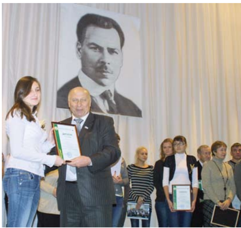
Награждение победителей Вавиловской олимпиады

надо восстанавливать межпоселенческие дороги, решать вопросы социального обустройства села, обеспечения местного населения водой. Нерешенных проблем в сельских поселениях остается достаточно. В соответствии с этим и строится моя работа в качестве депутата. Многие уже удалось сделать: в рамках программы модернизации образования «подтянули» школы, решаются проблемы с детскими садами. В этом году по инициативе фракции «Единая Россия» принято решение о выделении районам по 5 млн рублей на ремонт и содержание сельских домов культуры. В 2013 году в каждом районе планируется отремонтировать по три-четыре ДК. Что же касается непосредственно сельского хозяйства, то недавно депутаты областной думы приняли закон на основании рекомендаций ученых аграриев о поддержке селян с учетом природно-климатических условий и плодородия почв. Это особенно важно для районов Заволжья, так как позволит им получить поддержку на 15-16% больше по сравнению с другими муниципалитетами, в которых