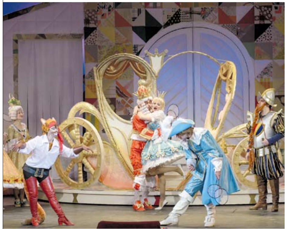
Усатый плутишка исполнил все желания хозяина...

В Саратовском академическом театре оперы и балета состоялась новогодняя премьера для юных зрителей.