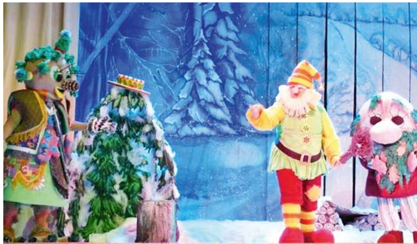
Новогодние сказки в филармонии особенно любимы саратовской детворой

Предпочтения в праздничной одежде отдаются серебристым, зеленым, темно-синим цветам и их оттенкам. Змея порадует вас облегающему платьем из гладкой блестящей ткани, которое будет напоминать по текстуре ее кожу. Леггинсы с имитацией змеиного узора, braslet в виде змейки, брошь, узорчатый галстук тоже призваны «умаслить» покровительницу года. Но главное в преддверии Нового года помнить, что лучшей «одеждой» для вашей души будет позитивный настрой на будущее и благодарность прошлому. С Новым годом, дорогие наши читатели!