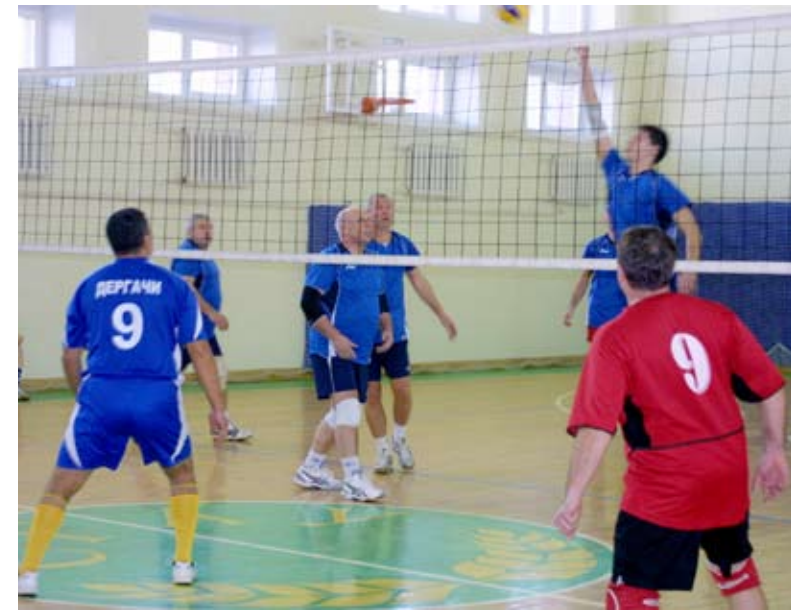
На игровой площадке кипели нешуточные страсти