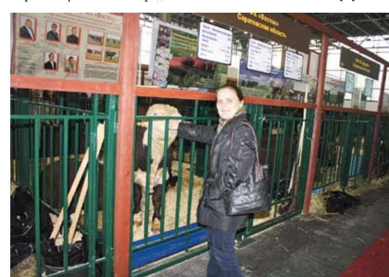
У звона с бычками казахской белоголовой породы ФХ «Восток»