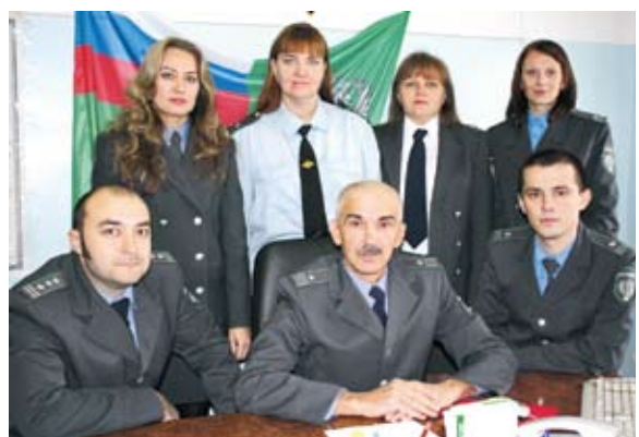
Отдел земельного контроля (надзор)

— Безусловно, ведь его работа направлена на предупреждение, выявление и пресечение фактов незаконного ввоза и оборота на территории области животных и продукции животного, животноводческого и растительного происхождения. Мы делаем все возможное, чтобы не допустить ситуации, произошедшей в Тверской области. Там предприятию-источнику пришлось уничтожить 33 тысячи голов свиней из-за африканской чумы. Главной нашей задачей является защита населения от проникновения возбудителей болезней животных, опасных для человека, и обеспечение употребления населением только качественной продукции.