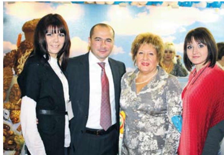
Участники выставки у стенда Саратовской области

По результатам конкурса Российской агропромышленной выставки «Золотая осень-2012» предприятия АПК региона по-