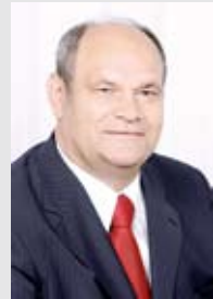
Василий Бочкарев, губернатор Пензенской области:

В день, когда губернатор региона Василий Бочкарев вручал победителям награды, шел дождь. Но в зале царил теплота и радость. На сцену поднимались люди труда. Не привыкшие к вспышкам фотокамер и звукам оваций, многие смущались и с трудом подбирали слова, чтобы выразить переполюбявшие их чувства: награды — это здорово, но как приятно просто ощутить себя в центре внимания.