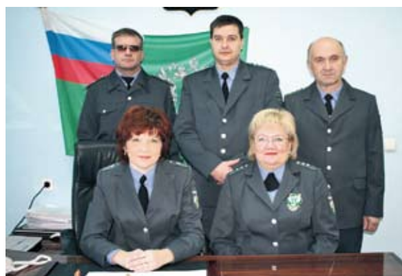
Отдел государственного ветеринарного надзора на Госгранице РФ и транспорте