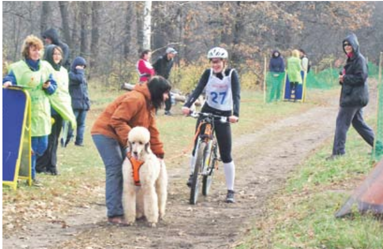
Спортсмен с четвероногим питомцем на старте

От слов организаторы быстро перешли к делу, и уже этой весной