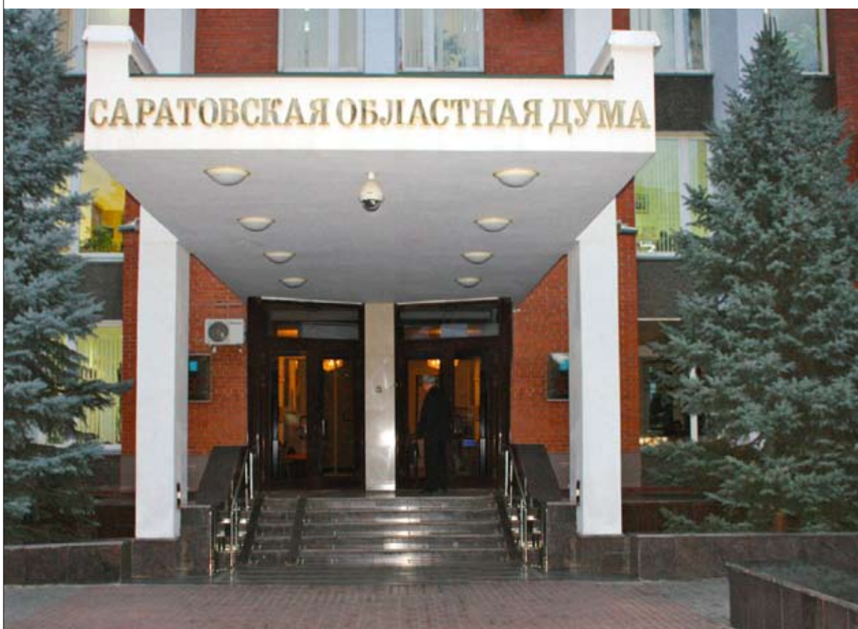
60 процентов депутатов избраны в Саратовскую областную думу впервые

На 23 ноября запланированы пресс-конференция, погашение марки Почты России с видом консерватории, презентация юбилейных изданий (энциклопедия, монография к 100-летию вуза, альманах студенческой жизни Alma mater и др.) и видеополемия о консерватории. 24 ноября состоится праздничный гала-концерт.