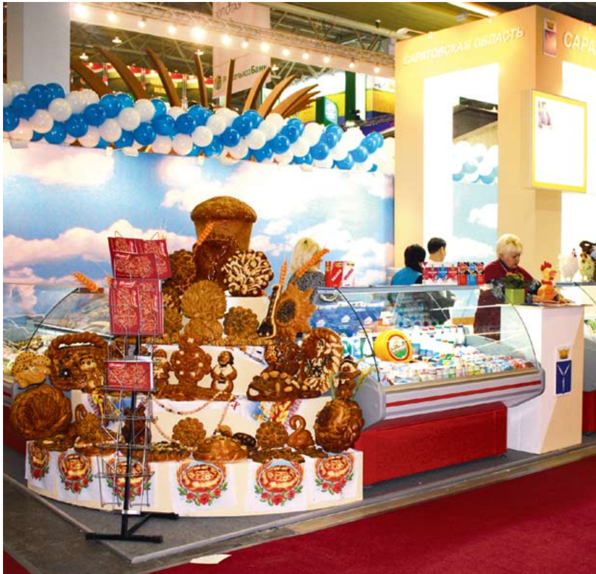
Участие в ежегодном смотре достижений АПК — дело престижа для многих отечественных производителей

Открывая агрофорум, министр сельского хозяйства РФ Николай Федоров выразил уверенность, что «щедрый и красочный праздник даров земных никого не оставит равнодушным, подарит заряд бодрости и хорошего настроения. А обширная деловая программа предоставит возможность аграриям обсудить насущные вопросы, обменяться накопленным