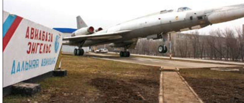
На энгельсскую авиабазу прибыла делегация из США