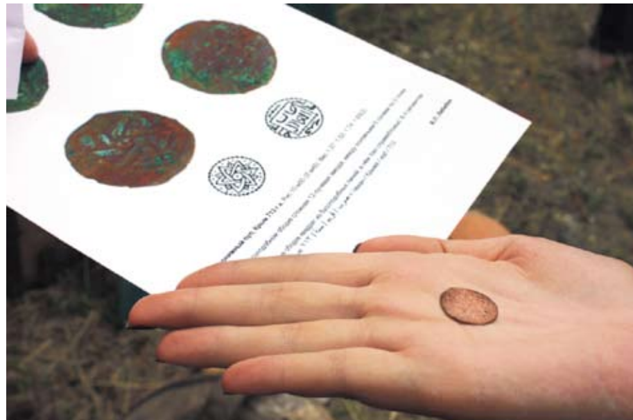
Крымская монета 1313 года