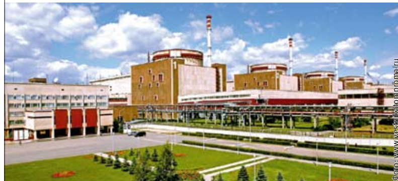
Увеличит ли мощность Балаковская АЭС?