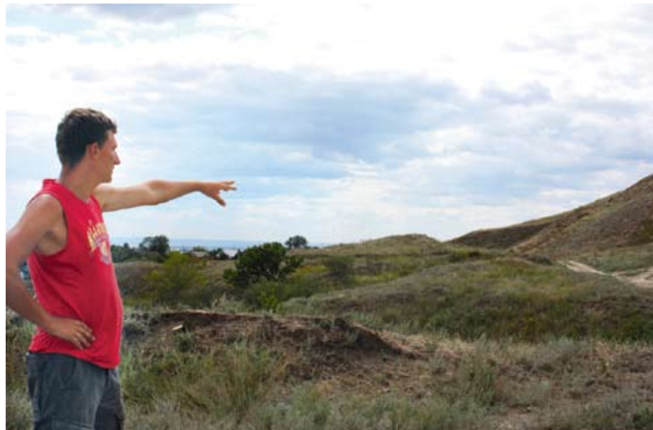
На этом месте пройдет праздник древности

трализованного праздника «Один день из жизни средневекового города Увека», который будет приурочен к празднованию Дня города в Саратове. Он пройдет в рамках научно-практического семинара «Изучение, сохранение и популяризация археологического наследия Увекского городища». К нам в гости приедут ведущие мастера исторической реконструкции России. На глазах у посетителей городища гончары, кузнецы изготовят вещи, подобные тем, которые саратовские краеведы находят спустя столетия. И если слух о нашем Увеке пройдет хотя бы по Поволжью, тайны древнего Увека заинтересуют многочисленных туристов. Тем более что наша область находится в перманентном поиске местного бренда. А искать-то и не надо. Схожая Увецкого городища открывается потрясающая панорама на современный Саратов. Вниз по Волге сплавляется баржа, параллельно движется железнодорожный состав. Наверное, так же семь веков назад хозяева Увека наблюдали, как приближаются к городу иноземные купцы. Когда находишься на Увекском городище, многовековая полифония поглощает тебя полностью. Проникаешься уважением к людям, которые много столетий назад создали мощнейший строительный, торговый центр Поволжья. Создали с любовью. И эту самую любовь не всегда найдешь в современных саратовцах. Давайте учиться у предков.