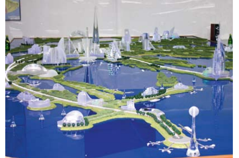
Фантастический проект застройки Зеленого острова