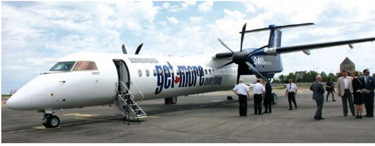
На таких самолетах, возможно, скоро будут летать саратовцы

В Саратове прошла презентация нового самолета канадского производства Q400 NextGen. Транспортные чиновники рассматривают возможность перевозки такими стальными птицами нового поколения саратовских пассажиров.