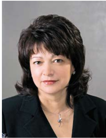
Уважаемые жители Саратовской области!

Искренне поздравляю вас с одним из главных международных праздников —