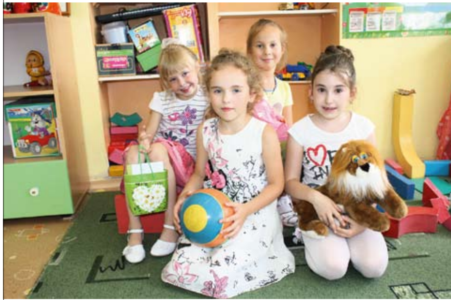
Воспитанницы подготовительной группы № 3

В канун Дня защиты детей «Известия» в Приволжье побывали в необычном детском саду, воспитанники которого готовились к своему первому «выпускному». Это учреждение отличается тем, что здесь детей учат не только азам счета и письма, но и пониманию прекрасного.