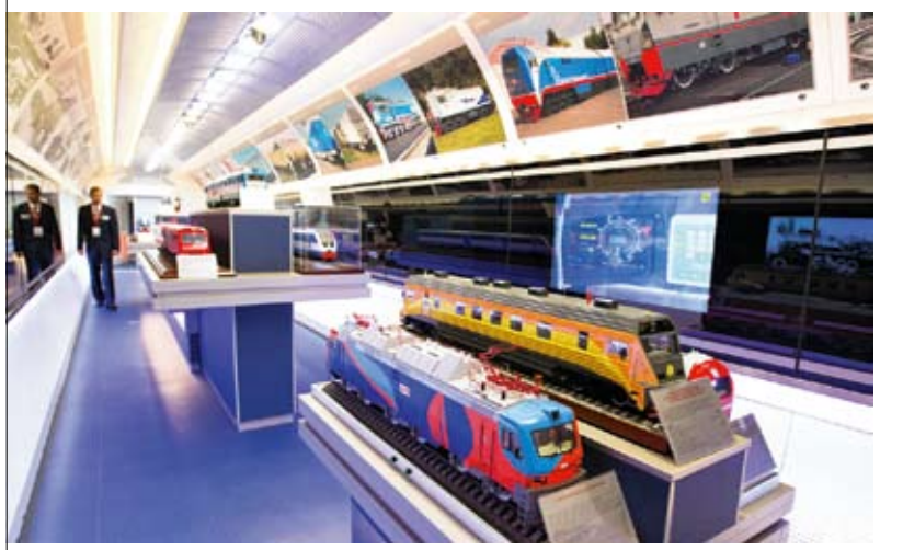
Поезд инноваций посетили около 4 тысячи саратовцев

Передвижной выставочно-лекционный комплекс был создан с целью демонстрации отечественных инновационных достижений. В первых вагонах были представлены экспозиции, посвященные современному подвижному составу, макеты поездов «Сапсан», «Аллегро» наглядно демонстрировали современный этап реализации программы развития высокоскоростного движения в России. Эти поезда набирают скорость до 220-250 километров в час, но экскурсовод сообщает: это не предел. Уже к 2018 году Москву и Санкт-Петербург соединит новая железнодорожная магистраль, по которой будут курсировать поезда со скоростью 350-400 км/ч. Время в пути сократится до двух с половиной часов. Ускорится движение и на других до-