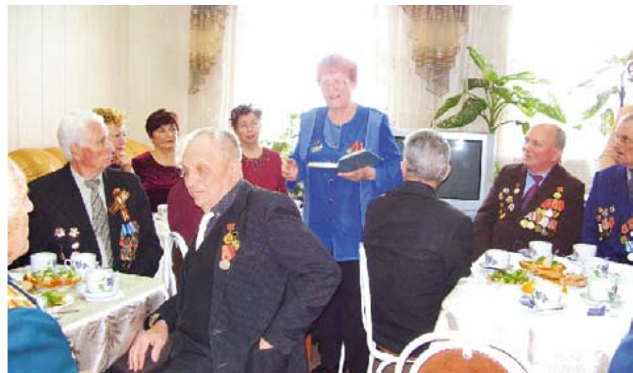
Одна из добрых традиций центра — встречи с ветеранами войны

Сотрудники ЦСОН постоянно ищут наиболее эффективные социальные тех-