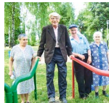
Подопечные Ртищевского центра окружены заботой и вниманием

положении, не могут создать необходимые условия для нормальной жизнедеятельности и отдыха детей. В последние годы особое внимание уделяется организации досуговой деятельности ребят в летний период: формируются детские площадки, городские лагеря или летние досуговые группы для реабилитации, развития и отдыха детей в летнее время. Объясняется эта потребность многими причинами, и прежде всего отсутствием у родителей материальной возможности купить путевку в загородный лагерь или снять дачу. Летние оздоровительные досуговые группы, организованные ГАУ СО «КЦСОН Ртищевского района», предназначены в первую очередь для несовершеннолетних из семей, находящихся в социально опасном положении и трудной жизненной ситуации, летний досуг и отдых которых по разным причинам остался без внимания семьи, школы и других детских организаций и учреждений.