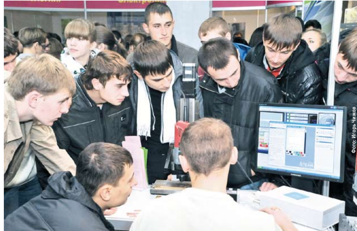
IT-технологии популярны у молодежи