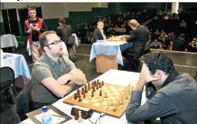
Напряженная борьба за Кубок губернатора

Восьмого октября в Саратовском государственном социально-экономическом университете начался Международный шахматный турнир на Кубок губернатора Саратовской области, посвященный 80-летию вуза. Организовали турнир правительство области, министерство спорта, СГСЭУ и Саратовская региональная общественная организация «Федерация шахматистов». Шахматные состязания такого высокого уровня в нашем регионе проходят впервые.