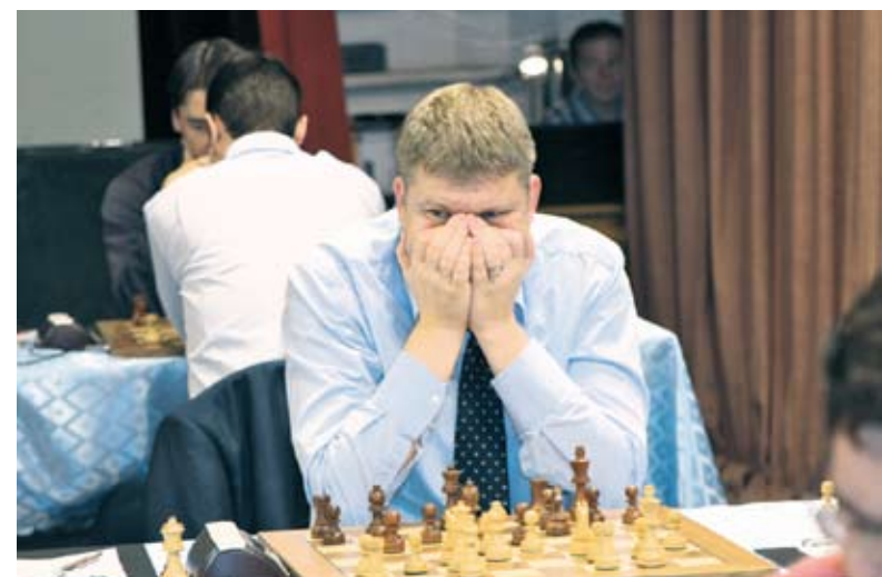
Турнир продлится до 19 октября

Шахматный турнир в СГСЭУ продлится десять дней. 19 октября на церемонии закрытия победителей наградают 12-й чемпион мира по шахматам Анатолий Карпов и губернатор Саратовской области Павел Ипатов. В игровые дни — с 8 по 13 и с 15 по 19 октября — вход в концертный зал СГСЭУ для всех желающих насладиться этой древней игрой свободный с 15.00 до 19.30.