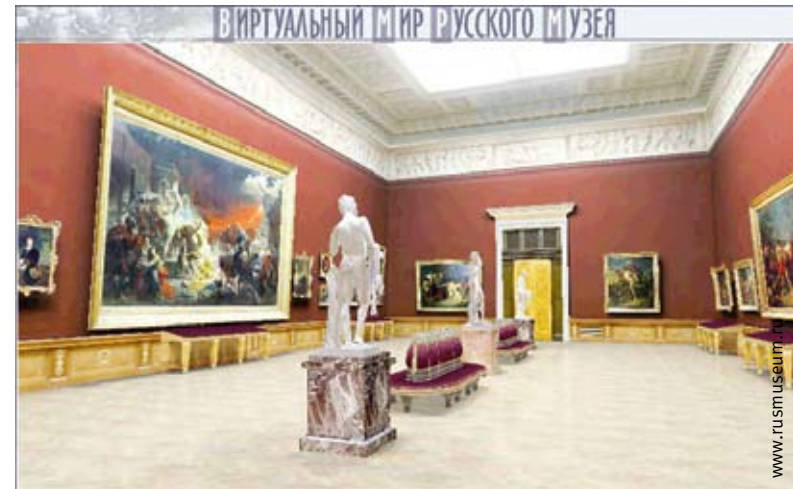
Экспозиция Виртуального филиала Русского музея

Поднятая на конференции тема более чем актуальна, поскольку в наш век новейших информационных технологий посещение традиционных музейных экспозиций все чаще заменяется электронными музейными каталогами, выставленными в интернете, и мультимедийными образовательными лекциями в мобильных виртуальных филиалах ведущих музеев мира, сменяющими свои экспозиции в зависимости от желания посетителя. Тем примечательной, что итогом недельной работы явилось множество различных идей, направленных на использование современных информационных технологий в выставочной деятельности музеев, а также на разработку и применение электронно-образовательных ресурсов в различных видах деятельности.