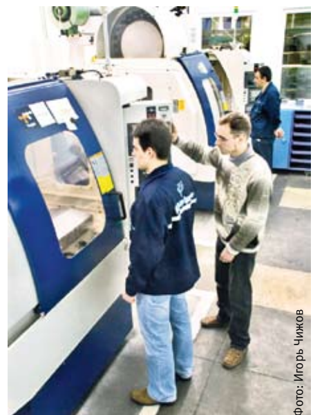
Инвестиции в деле

Заметим, что Кубрин недавно был назначен инвестиционным уполномоченным Президента РФ в Приволжском округе. Распоряжение о создании в округах институтов инвестиционных уполномоченных, призванных помогать решению проблем на местах, в частности, убыстряя согласование разрешительных документов, было подписано в марте текущего года. Алексей Кубрин, вступивший в должность 2 августа, думается, успел ознакомиться с положением дел в округе. В августе, например, он уже побывал в Саратове, встречался с предпринимателями и