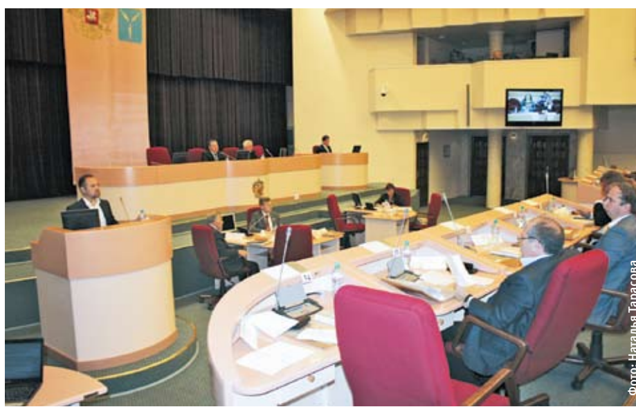
«Подросший» бюджет города позволит решить первоочередные проблемы

— Правила торговли одинаковы для всех, — рассказал он. — Недопустима торговля на остановках, в местах большого скопления людей — для этого есть специально отведенные хозяйственные зоны. Ведь если тротуар зауживается и образуются торговые ряды — это доставляет неудобство пешеходам. В Саратове выде-